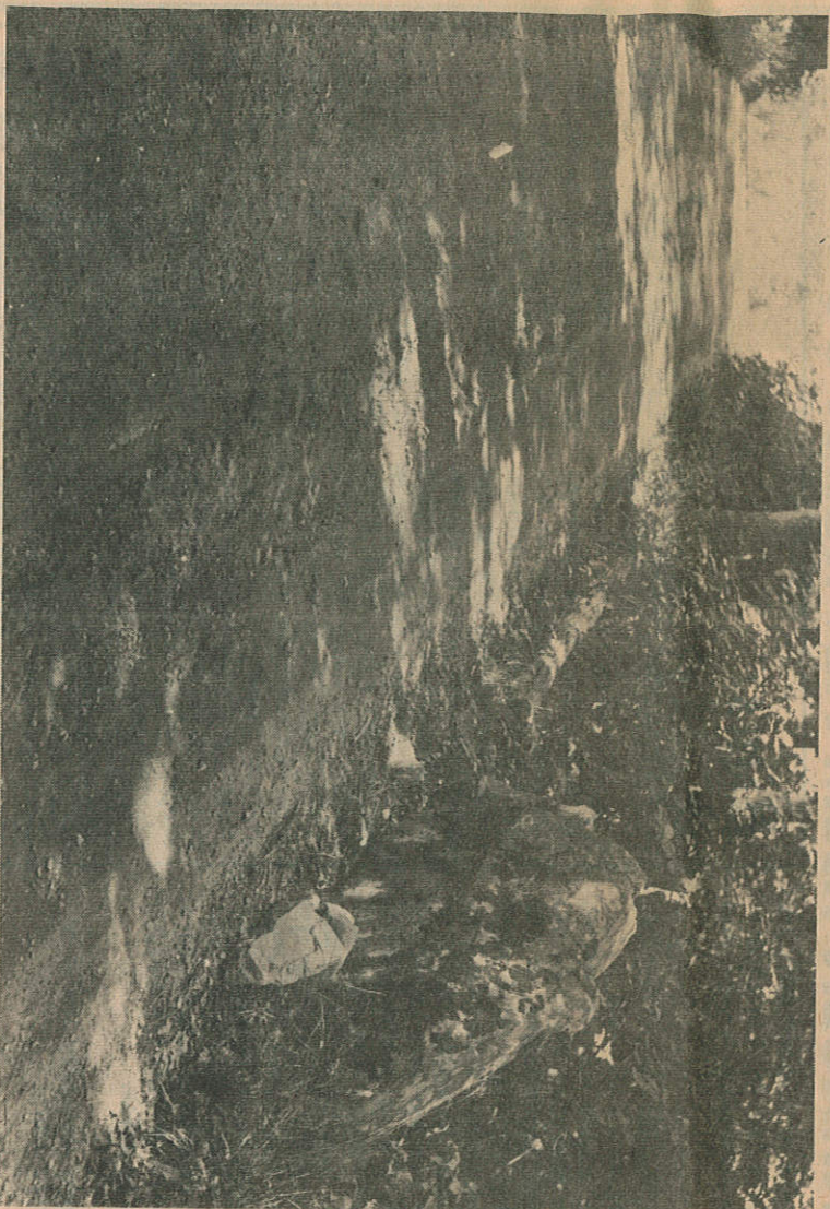
Den store steinen t. h. i bakken er det gamle veirodemerket.

I en protokoll over senere rodemestere som beror på velkommen Forts. side 11.