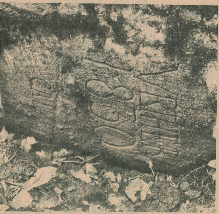
Her ser vi innskriften.

Behindes nogen Forsømmelse at være begaaet, ihendseende til Sneplougkjørsel eller det øvrige Veiarbeide om Vinteren, skal Rodemesteren uopholdeligen lade det manglende Arbeide utføre ved ledede Folk for den eller de Skyldiges Regning. Det samme paaligger Lensmanden, naar han ved Befaring maatte finde et